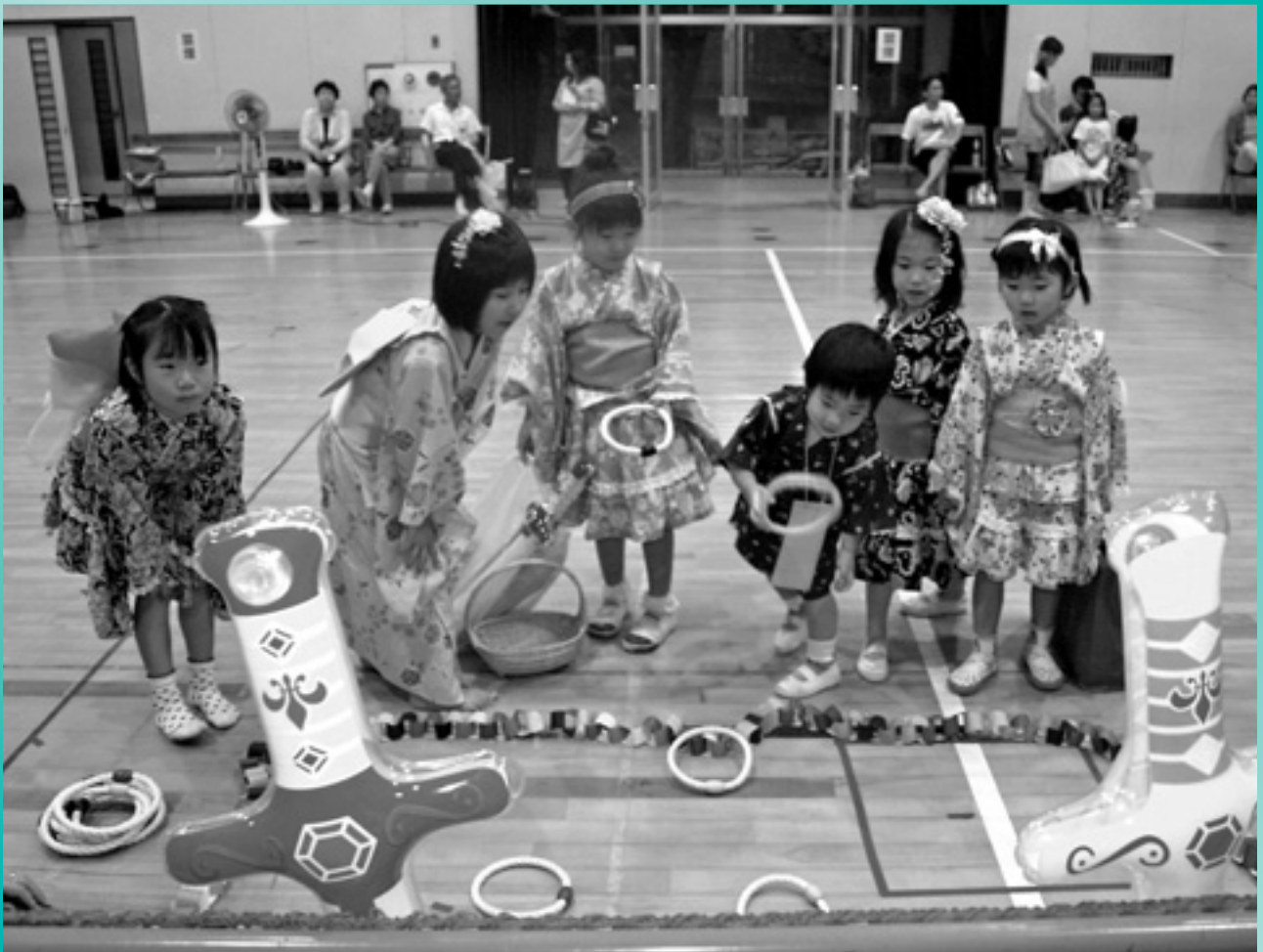
保育所 お楽しみ会にて