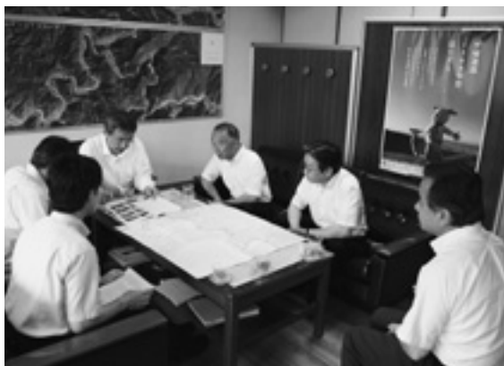
吉野土木事務所へ要望を行う上平村長