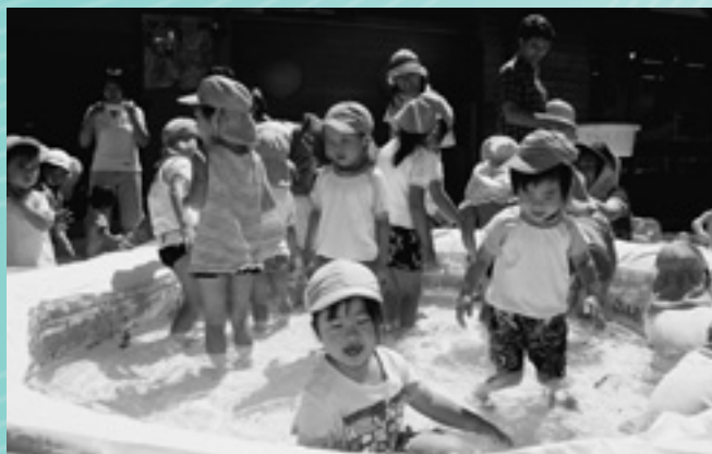
保育所 魚つかみ取りにて